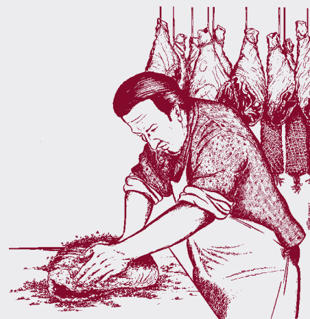
Le Salage du Jambon

(Tarif valable jusqu'au 30 octobre 2012 en France métropolitaine)